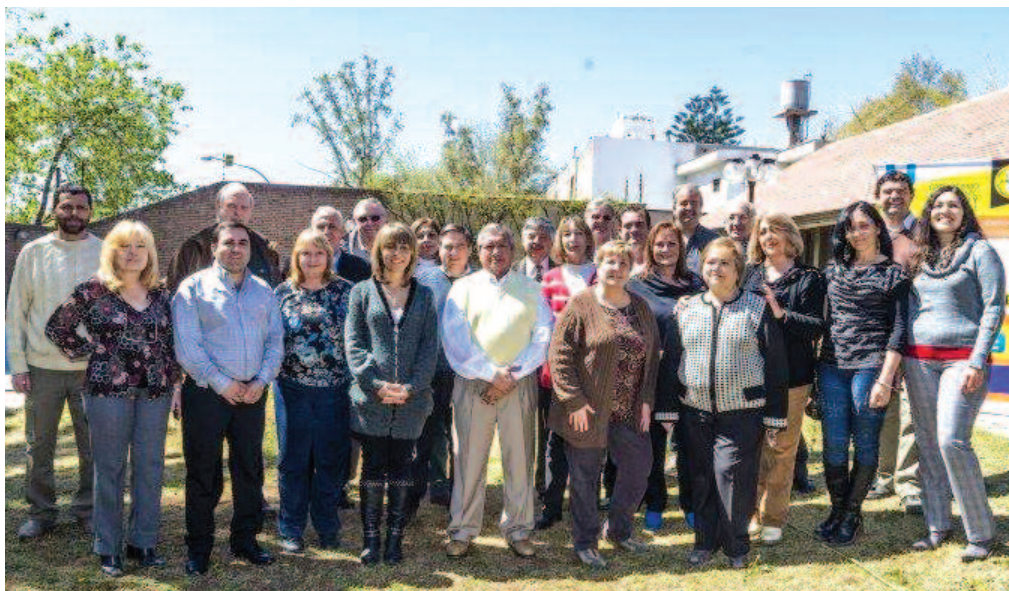
La Comisión Ejecutiva de AMProS.

El compromiso se renueva y de cara a la segunda parte del año seguimos investigando sobre temas que hacen a la realidad que se vive en cada hogar de nuestra provincia, siempre con el objetivo puesto en prevención de las enfermedades desde una mirada profesional y en la defensa de los derechos de quienes se encargan de cuidar la salud de los mendocinos.