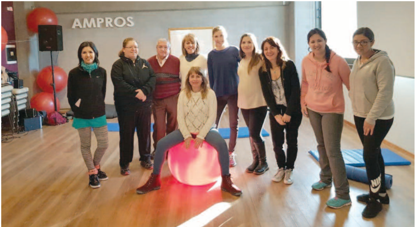
En las instalaciones de AMProS hubo desayuno y clase de yoga para festejar el séptimo aniversario.